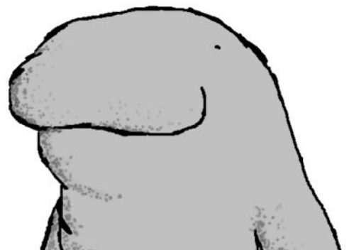
Seekuh-Logo der FH Hildesheim

Spendenquittungen stellen wir Ihnen gerne ab einer Höhe von 100 € aus, darunter gilt Ihr Kontoauszug als Bescheinigung.